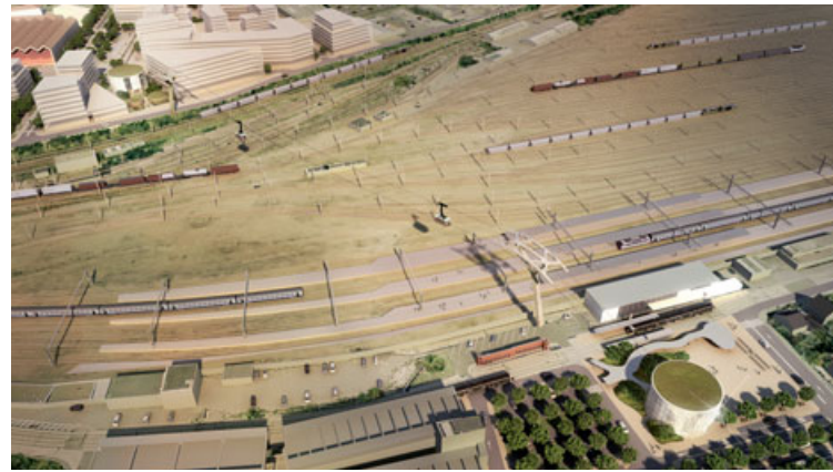
© GROUPEMENT VINCI, AGENCE DUTHILLEUL/ILLUST. SERGIO CAPASSO

Les deux cabines s'inspireront d'ailleurs du design de la seconde ligne de tram, reprenant notamment le