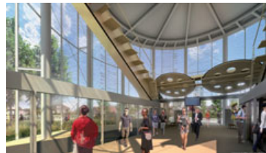
© GROUPEMENT VINCI, AGENCE DUTHILLEUL/ILLUST. SERGIO CAPASSO