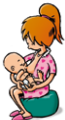
Problèmes de développement du fœtus