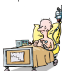
Développement de cancers

Les pesticides constituent une atteinte grave à notre santé et à notre environnement.*