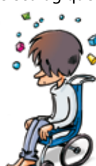
Maladies des nerfs et du cerveau