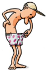
Baisse de la reproduction

Les dommages collatéraux générés sur la faune, la flore sont considérables. Du fait de leur grande toxicité, de leur large spectre d'action, de leur accumulation, les pesticides éliminent également les prédateurs et parasites naturels, les pollinisateurs. La chaîne alimentaire est ainsi perturbée et l'équilibre écologique est mis en péril.