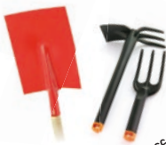
une pelle, une griffe