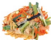
déchets de cuisine