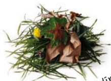
déchets de jardin